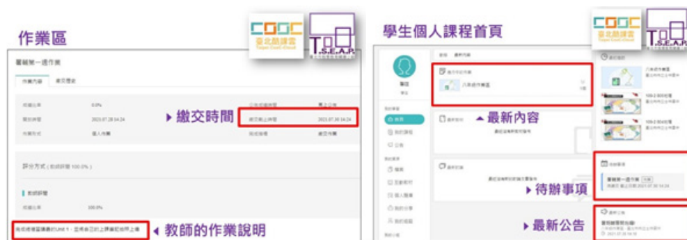
圖 3-1 酷課 OnO 線上教室作業繳交畫面